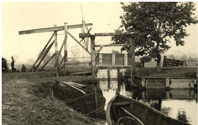
Turfschuitjes in de Schipsloot van Vriezenveen

teveel turf steken werd in 1684 gezet op deze twee goudgulden voor een voer turf. Hoewel de naam (dubbel) anders suggereert, werd de goudgulden van zilver gemaakt met de waarde van 28 stuivers 5 . Twee goudgulden toen zijn te vergelijken met 500 à 1000 euro's nu.