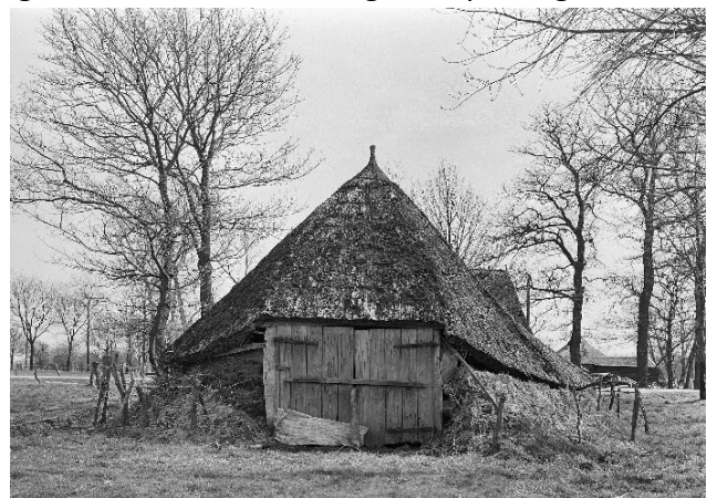
Schaapskooi in Hoge Heksel.

Voor het verbouwen van voedselgewassen is bemesting nodig. De hoeveelheid mest van het eigen vee was veel te gering. Daarom werden met name dikke heideplaggen, maar ook graszoden gebruikt om de voedselarme zandgronden te verrijken 3 . Door plaggen in de potstal uit te spreiden, werden ze vermengd met uitwerpselen van het vee. Dit werd als bemesting op het bouwland gebracht. Voor deze