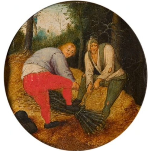
Twee mannen binden takken samen (Pieter Brueghel de Jonge, Rijksmuseum Twente)

Het bos leverde takken, twijgen, sprokkelhout, blad en strooisel, maar ook eikels, noten, bessen en eek (eikenschors).