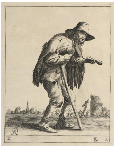
Pieter Jansz. Quast, Melaatse Bedelaar , 1638 (Museum Boymans van Beuningen)

Tegelijkertijd probeerde de marke zichzelf te beschermen. In 1574 werd er grond verkocht om de begroting van de marke rond te krijgen. In de voorwaarden staat dat bewoners van ongewaarde erven niets mogen kopen: er is in toegestemd dat geene Bijsitters offte Coveners eenige der Hoffkens offt Gaerdekens koopen sollen . Dezelfde motivering zien we terug in 1614 als vermeld wordt dat Coveners oder Brincksitters niet toegelaten mogen worden, omdat zij heiden en weiden gebruiken. Tegelijk moest een zekere Herman in 1614 zijn hut afbreken, net als anderen die in schuren en bakhuizen woonden.