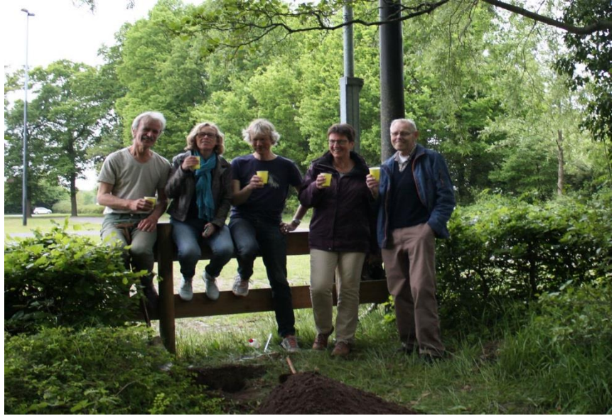
Figuur 5. De gravers

Keisteen N o 8 (proces-verbaal 1820: keisteen gelegen in het Minnebroek) heeft tot enkele jaren geleden op zijn oude plek gelegen. Toen er een villa nabij de steen gebouwd werd, is de steen 20 meter verplaatst naar de plek aan het voetpad, zie figuur 6. Dit voetpad volgt, richting het stadskantoor, de oude markegrens van Woolde en Hasselo.