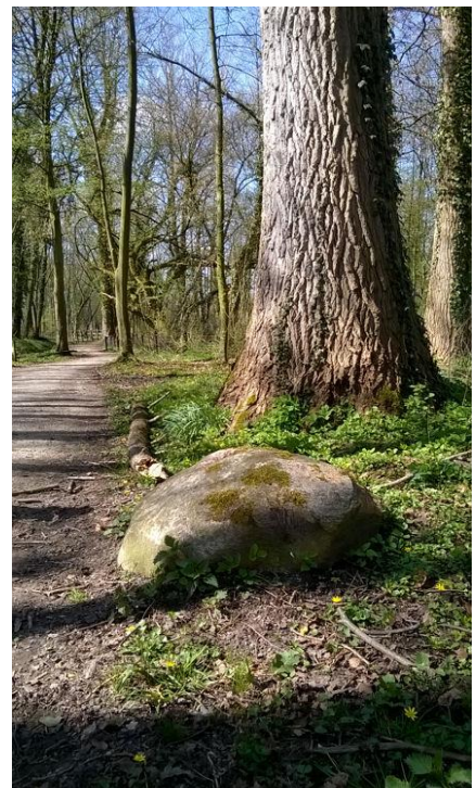
Figuur 6. Steen in het Minnebroek

De werkgroep bestaat op dit moment uit Ellen Beerens, Rob Bloemendaal, Gerhard Post en Miny de Vries. Op zondag 18 oktober 2015 van 14:00 uur tot ongeveer 16:30 uur organiseren wij een fietstocht langs de grens van Woolde. De deelname is gratis, een gift voor Museum Hengelo wordt op prijs gesteld. U kunt zich aanmelden met een bericht naar hengelo@markegrenzen.nl (dit heeft de voorkeur).