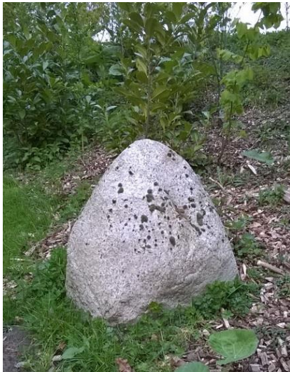
Figuur 2. De Welemanssteen

We besloten onze bijdrage in Hengelo toen&nu van april 2015 met keisteen N o 5, de Welemanssteen, die al heel lang verdwenen was. Volgens het markeboek van Woolde stond er al voor 1563 een laakpaal op deze locatie; in dit jaar is er sprake van een geschil rond deze paal. Laakpalen waren in die tijd meestal van hout ('laken' betekent 'inkerven'). Deze paal is dan later vervangen door een steen. Al op de oudste kadastrale kaarten is dicht bij de locatie water te vinden. Mevrouw Van Harten-Fransen 2 meldt dat volgens de heer Kotte de steen in de kuil [met water] gezonken moet zijn. Deze kuil was later een vijver, welke enkele jaren geleden is leeggepompt. Daarbij kwam een grote kei tevoorschijn, welke dus heel waarschijnlijk de markesteen is. De steen staat nu vlakbij zijn oorspronkelijke plek, maar op privéterrein, en is dus niet te bezichtigen.