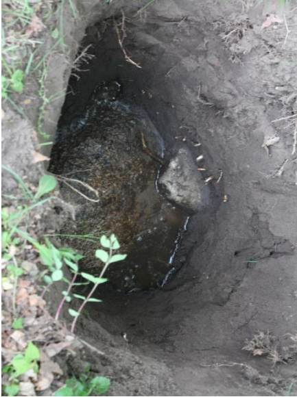
Figuur 4. De steen bij Wegter

op, maar bij een laatste poging werd de steen gepeild op een goede meter van de gemarkeerde plek, 55 cm diep. Twee dagen later hebben we door het graven van een groot gat geconstateerd dat hier echt een grote kei in de grond zit, zie figuur 4. In figuur 5 wordt geproost op de steen, die net naast het parkeerterrein van het stadskantoor in de grond zit. Het omhooghalen van de steen van oom Johan staat hoog op onze wensenlijst.